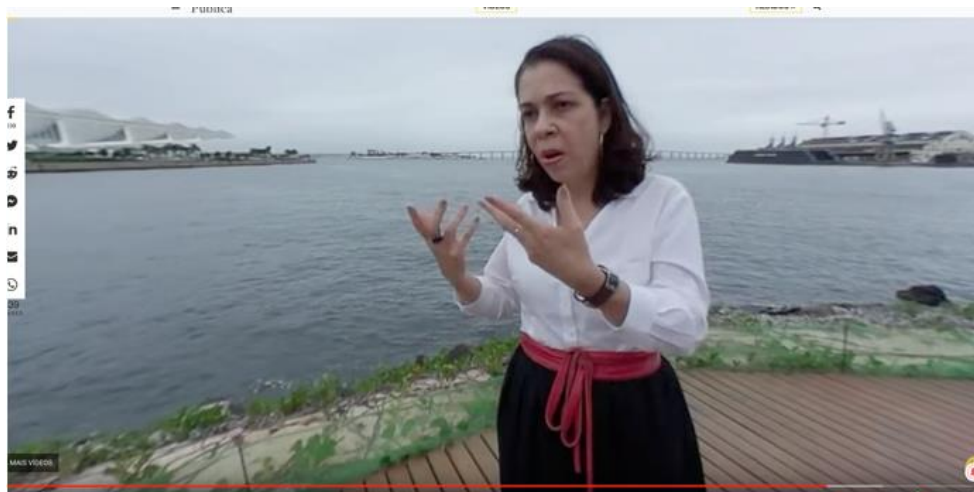
Figura 4 - Recorte para a entrevistada