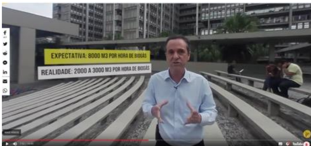
Figura 2 – Detalhe de elementos explicativos no vídeo da Agência Pública

Desenvolvido para Android e IOs, o app do El País (Figura 1) apresenta vídeos com roteiro pré-definido e conta apenas com algumas legendas explicativas para contextualização de algum lugar ou cenário. A narrativa dá-se nos cenários que deram origem aos documentários, como em “Ayotzinapa”: a sepultura aberta, que foi gravado no México; e Aleppo: patrulha com os White Helmets sírios, que foi gravado na Síria. Com a narrativa em primeira pessoa, o internauta consegue obter a postura de observador do ambiente, com uma interação restrita à movimentação a partir de toque sensível na tela ou com o movimento do celular, ativando o acelerômetro.