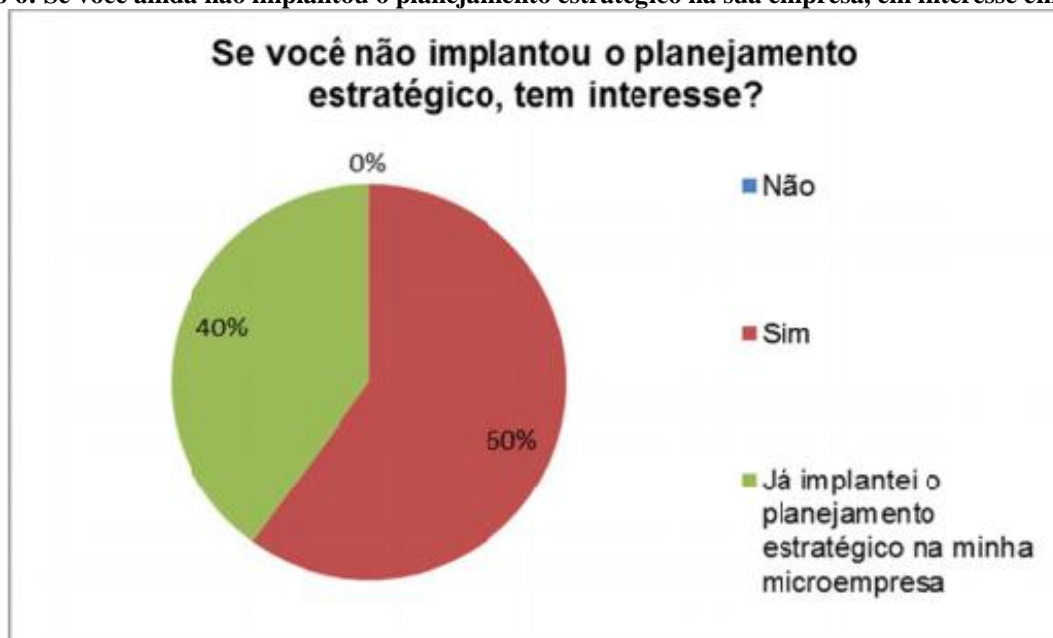
Gráfico 6: Se você ainda não implantou o planejamento estratégico na sua empresa, em interesse em fazê-lo?

A sexta e última questão perguntou se os microempresários que ainda não implantaram o planejamento estratégico tem interesse em fazê-lo. Os microempresários, na sua maioria de 60%, declararam que querem implantar o planejamento estratégico e 40% deles afirmaram que o planejamento estratégico já foi implantado, de acordo com o gráfico a seguir: