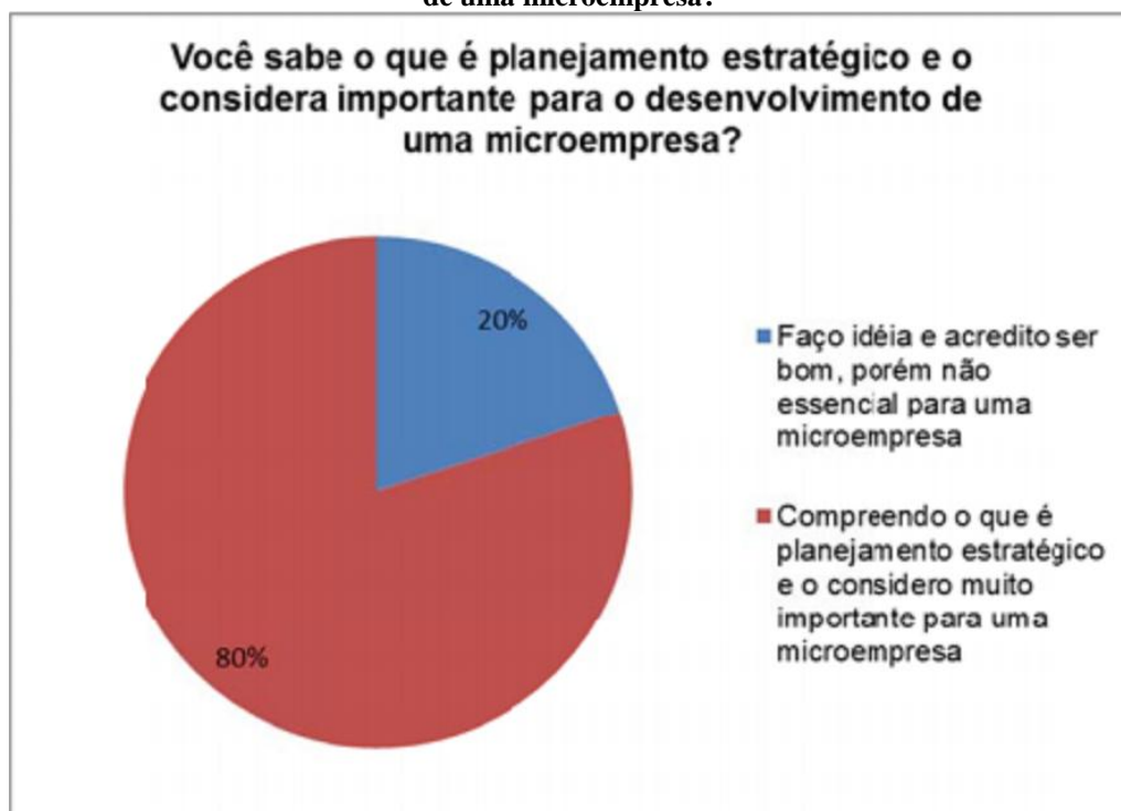
Gráfico 4: Você sabe dizer o que é planejamento estratégico e o considera importante para o desenvolvimento de uma microempresa?

A quarta questão perguntou aos entrevistados se eles sabem o que é planejamento estratégico e se eles o consideram importante para o desenvolvimento de uma microempresa. Ninguém afirmou não saber do que se trata, 20% faz ideia e o considera importante, porém não essencial, e a grande maioria, 80% sabe o que é e considera o planejamento estratégico muito importante para o desenvolvimento de uma microempresa. Desta forma, verifica-se que a informação sobre a importância e os benefícios do planejamento estratégico está chegando aos microempresários, porém, colocar isto em prática ainda não é algo muito comum.