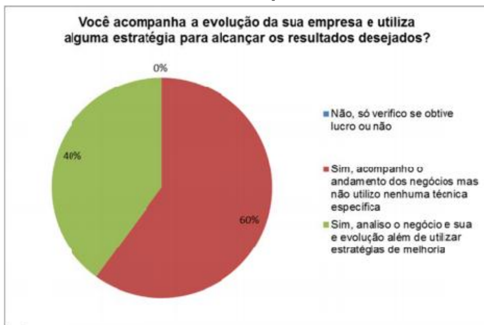
Gráfico 5: Você acompanha a evolução da sua microempresa e utiliza alguma estratégia para alcançar os resultados desejados?

A questão cinco perguntou se os microempresários acompanham a evolução da empresa e se utilizam alguma estratégia gerencial para alcançar os resultados desejados. Ninguém informou que não acompanha a evolução da microempresa. A maioria afirmou que acompanha o andamento dos negócios, mas não faz uso de nenhuma técnica gerencial específica e 40% disseram que acompanham o negócio e utilizam estratégias de melhoria.