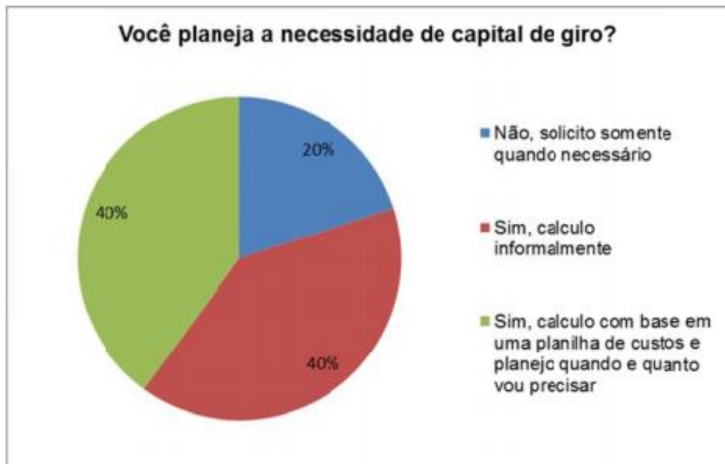
Gráfico 3: Sua empresa planeja e calcula a necessidade de capital de giro?