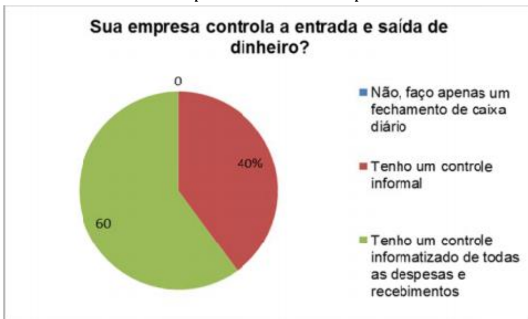
Gráfico 2: Sua empresa controla o fluxo de despesas e receitas?

A segunda questão indagou se os microempreendedores controlam a saída e a entrada de dinheiro. Nenhum entrevistado afirmou não controlar este fluxo, o que é algo bastante positivo. Controlar cada saída e cada entrada de dinheiro permite que o empresário possa racionalizar as despesas e fazer com que o negócio tenha um rendimento maior. 60% dos entrevistados disseram que possuem um controle informatizado e detalhado das receitas e despesas e 40% controlam informalmente, conforme representado no gráfico a seguir: